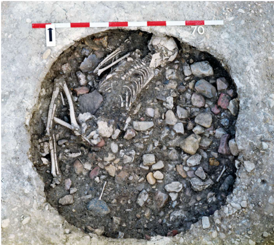
Le site des moulins (Saint-Paul-Trois-Châteaux, Drôme) a été fouillé en 1985 puis en 2001 avant la construction d'une grande surface. Parmi les 62 structures datées entre -4000 et -3600 ans, 13 contenaient des ossements humains. L'adolescente de la deuxième sépulture était entourée de restes de chien découpé, de faune, de céramique et d'outils.

Autant de découvertes qui révèlent la complexité des gestes, des croyances et des rituels mis en œuvre par les sociétés préhistoriques pour accompagner leurs défunts. L'archéologie préventive est aujourd'hui le moteur essentiel de ces découvertes. Elle révèle que les sociétés préhistoriques n'étaient pas seulement préoccupées par la survie, mais possédaient un univers symbolique complexe, où le traitement du mort reflétait fidèlement l'organisation et les tensions du monde des vivants. Ces enquêtes démontrent que, bien que les croyances précises nous échappent, les sociétés préhistoriques possédaient un univers symbolique complexe destiné à intégrer la mort dans l'ordre social.