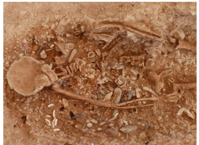
Sépulture paléolithique - Cuges-les-Pins

La défunte a été déposée dans une fosse immédiatement comblée, préservant des connexions anatomiques étroites. Les archéologues ont déduit la présence d'éléments disparus, comme un lit de végétaux ou une enveloppe en peau d'animal . Le corps était accompagné d'ocre et d'un riche mobilier : canines de cerf perforées et coquillages marins évoquant un collier.