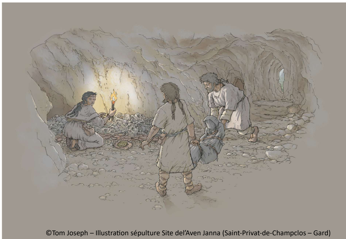
©Tom Joseph – Illustration sépulture Site del'Aven Janna (Saint-Privat-de-Champclos – Gard)

Pour cela, l'association Le Ressort apporte un regard contemporain, en proposant des dispositifs sensibles autour de la parole et du rapport à la mort aujourd'hui.